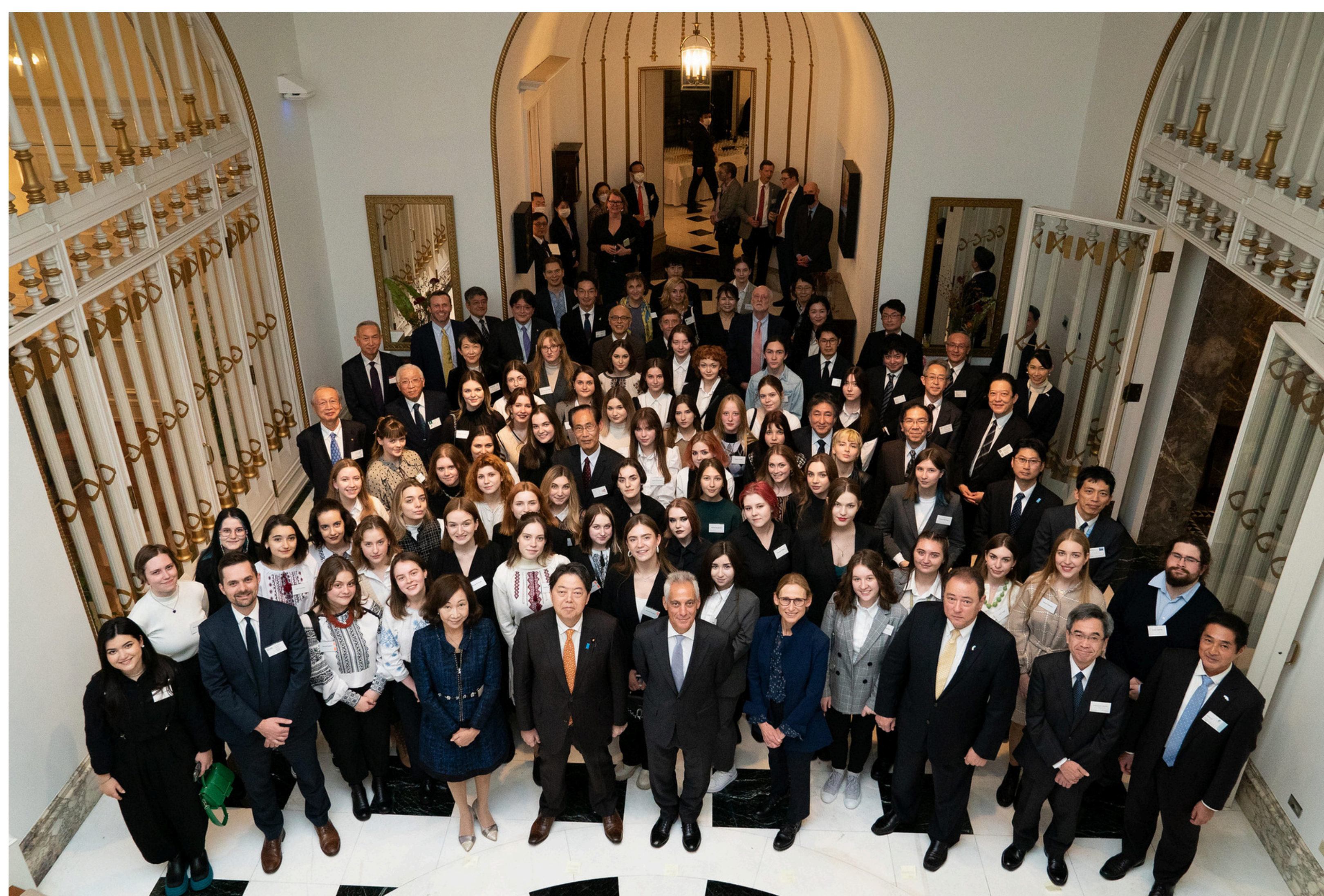
ラーム・エマニュエル駐日米国大使主催によるJUUP学生、 大学関係者および支援者のためのレセプション 東京 | 2022年12月8日