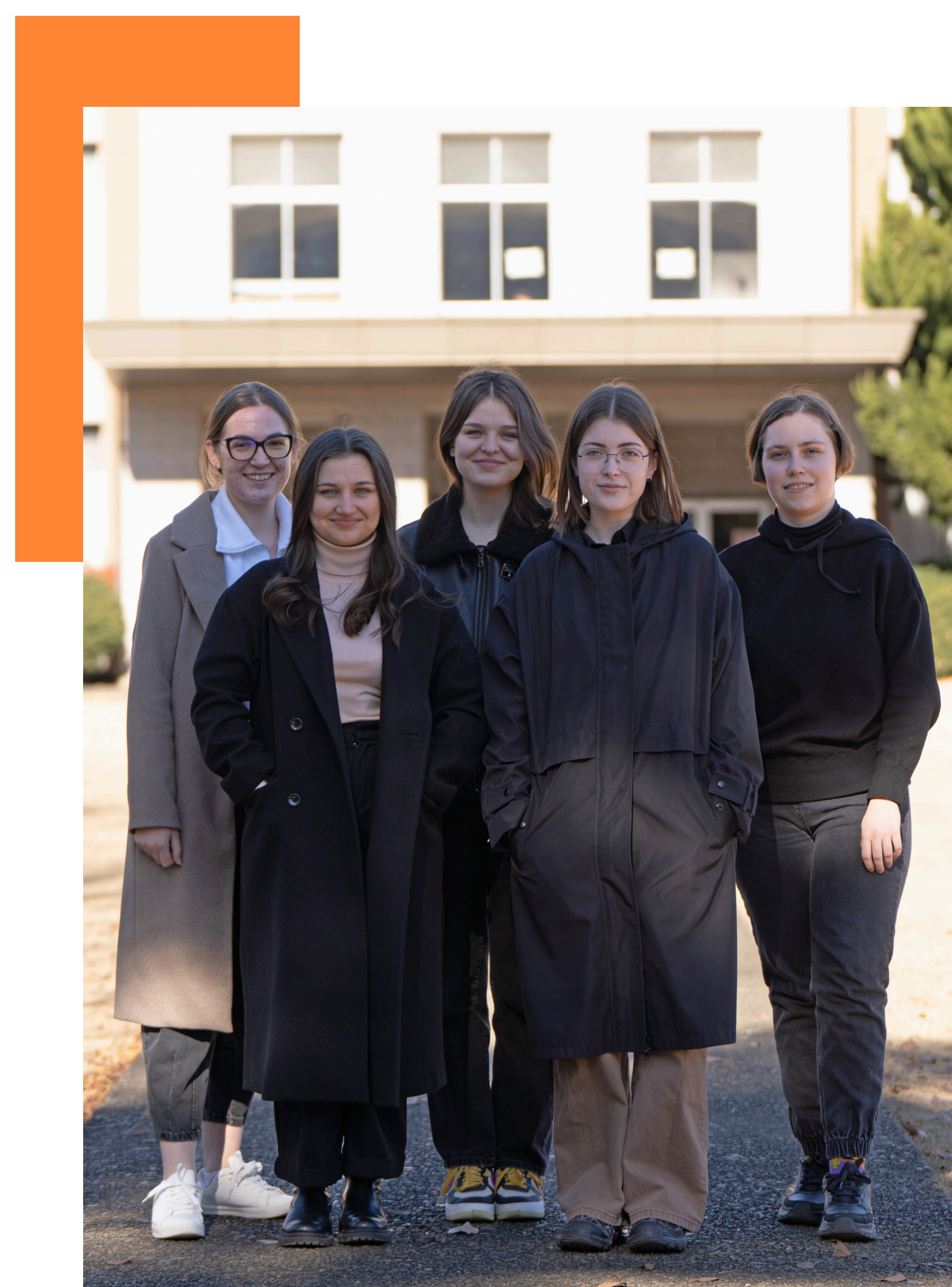
JUUPを通してICUに受け入れられた5人のウクライナ人学生

2023年から2024年にかけて、JICUFとPJはJUUPの追加募集を3回実施し、さらに25名の学生がメンバー大学に採用されました。JUUP初年度の詳細は、JICUFの2022年度の年次報告書に記載されています。 11