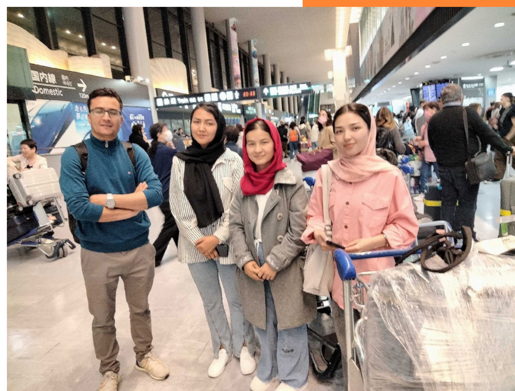
日本語学校に入学するために東京に到着したばかりのアフガニスタンの学生たち (2025年3月)

JLSPは当初シリア出身の学生のみを対象としていましたが、その後2021年にアフガニスタン、2022年にウクライナへと対象国を拡大し、今後もさらなる対象拡大を予定しています。2025年12月時点で、150名以上の学生が日本語学校に採用されており、このプログラムは高等教育および就労につながるパイプラインの役目を果たしてきました。