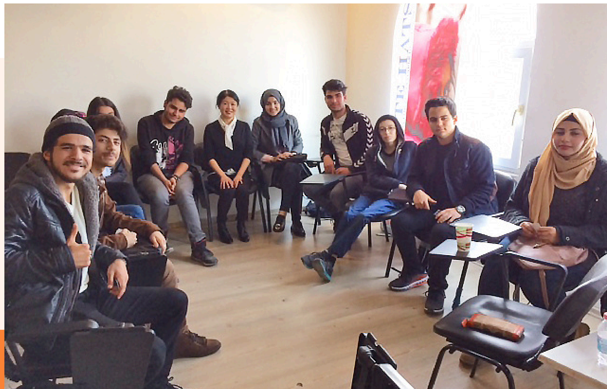
トルコ・ガズィアンテプでの説明会 (2018年3月)

2017年初頭、JICUFとJARはICUに対し、シリア人学生イニシアチブ（Syrian Scholars Initiative、SSI）の設立を提案しました。その後、慎重な協議を経て、3者は同年6月に覚書（MOU）を締結し、2018年から4年間にわたって、故郷を追われたシリア人学生を計6名募集し、ICUで学位を取得するまで支援することに合意しました。