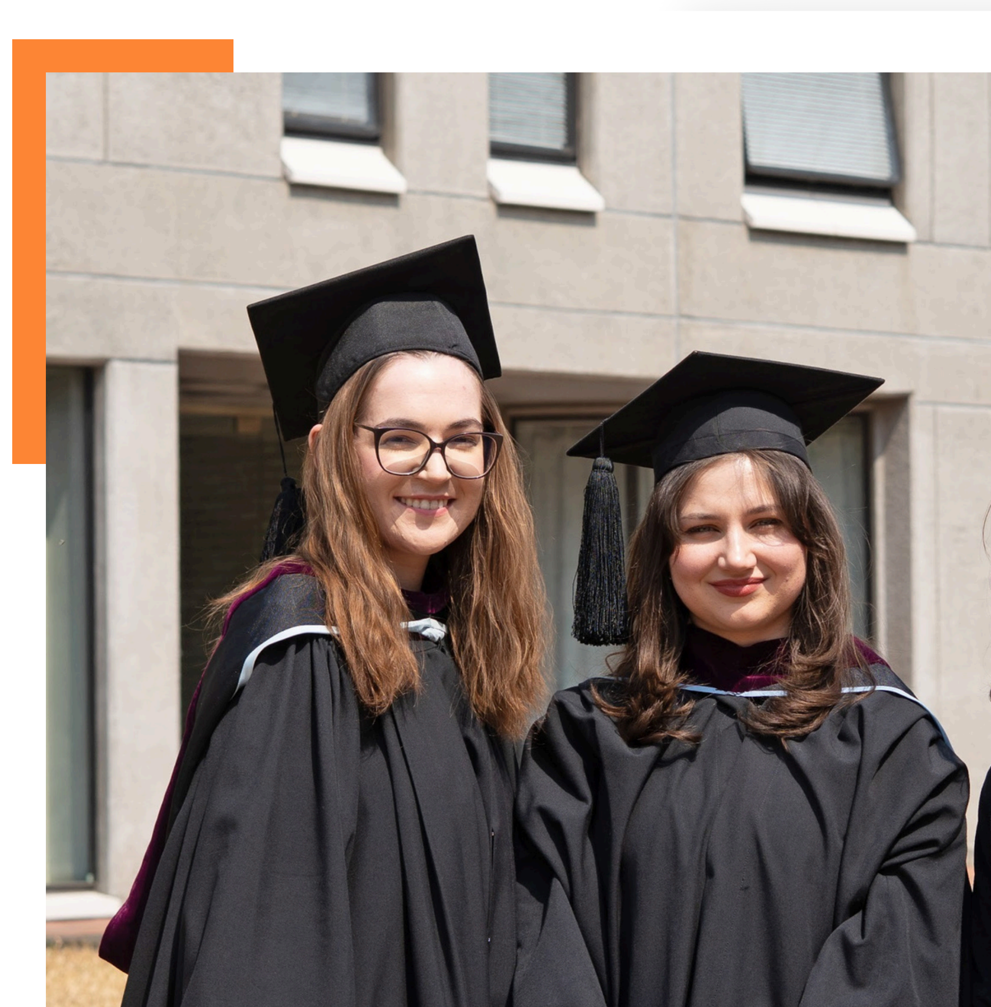
2025年3月にICU大学院を卒業したウクライナ出身の学生たち

しかし正式な資格がないからといって、彼らの能力が劣るわけではありません。世界的に、多くの教育関係者はこの点を理解しており、ユネスコ資格パスポート 12 やNPO・アマラ・エデュケーション（Amala Education）の「グローバル・セカンダリー・ディプロマ」 13 のように、従来の学歴資格に代わる代替的教育資格を認める動きも進んでいます。